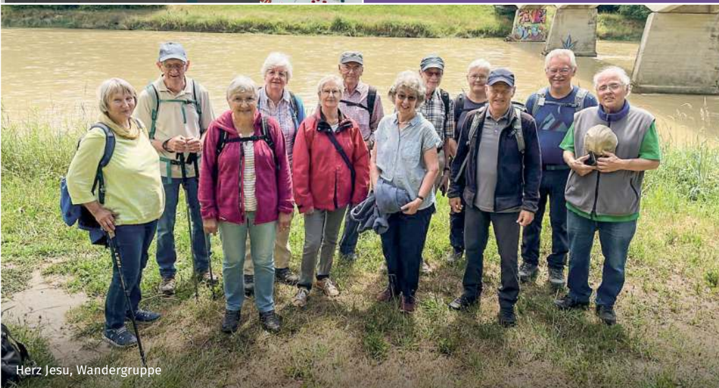
Herz Jesu, Wandergruppe