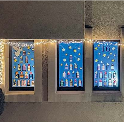
St. Josef, Adventsfenster