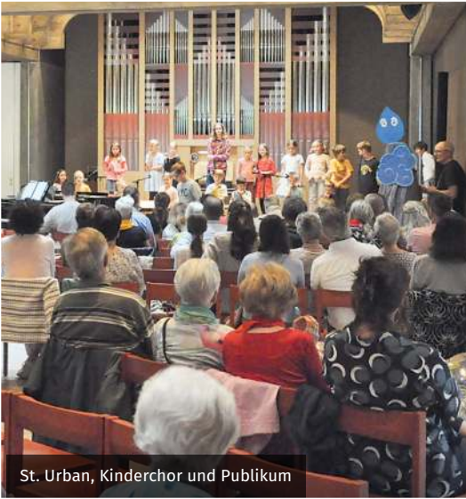
St. Urban, Kinderchor und Publikum