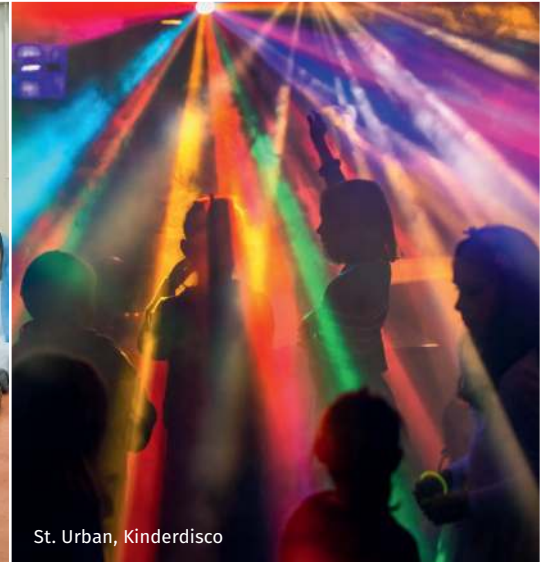
St. Urban, Kinderdisco