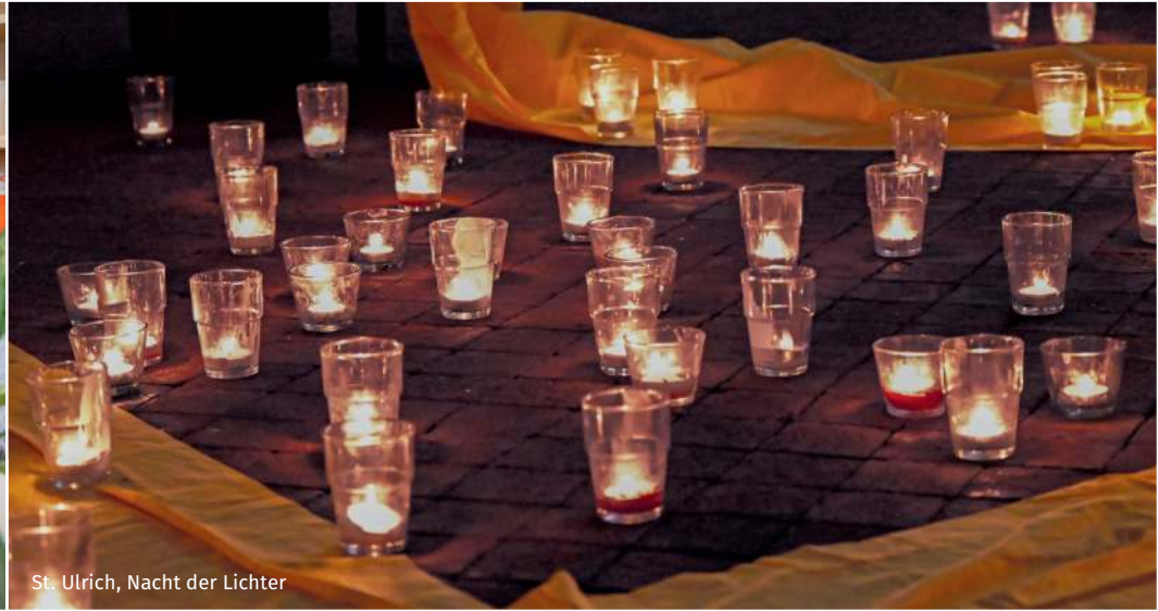
St. Ulrich, Nacht der Lichter