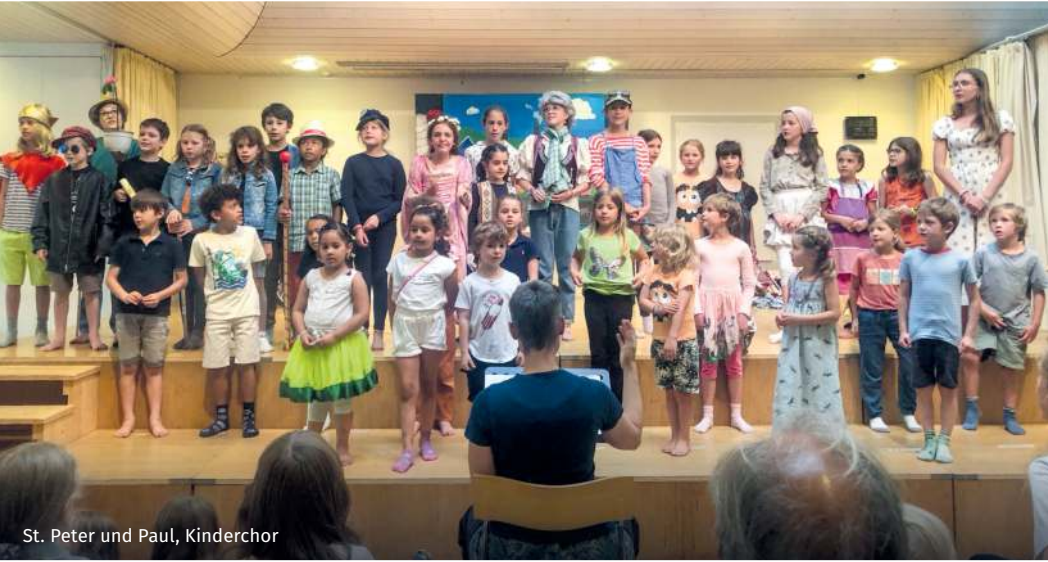
St. Peter und Paul, Kinderchor