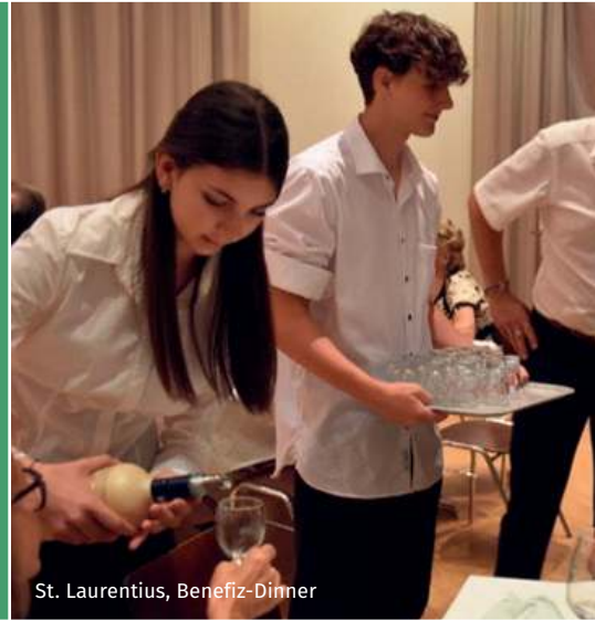
St. Laurentius, Benefiz-Dinner