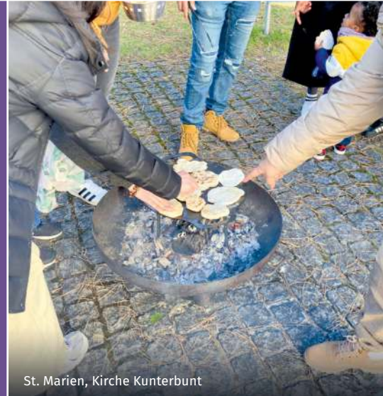
St. Marien, Kirche Kunterbunt