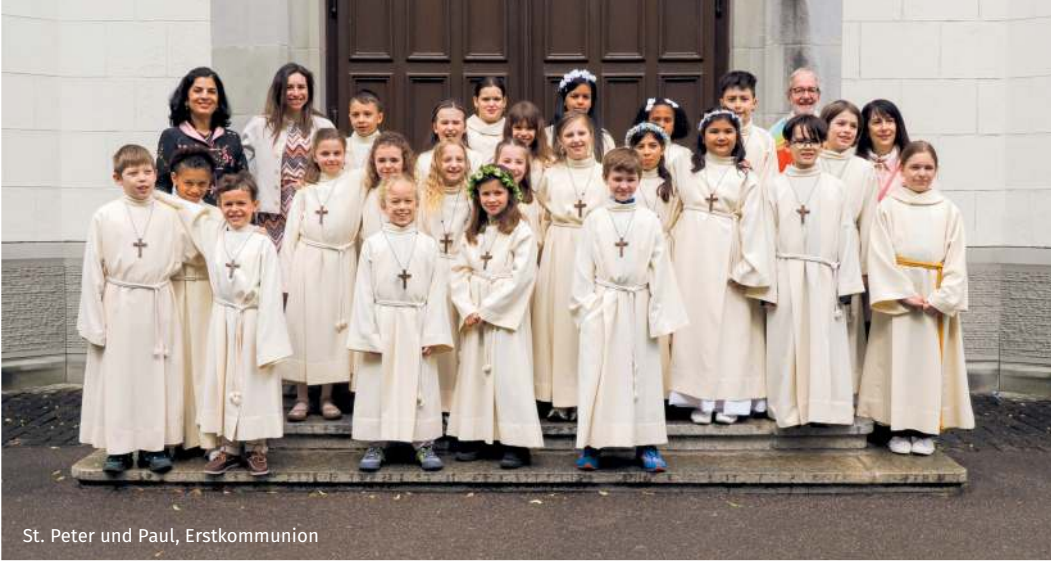
St. Peter und Paul, Erstkommunion