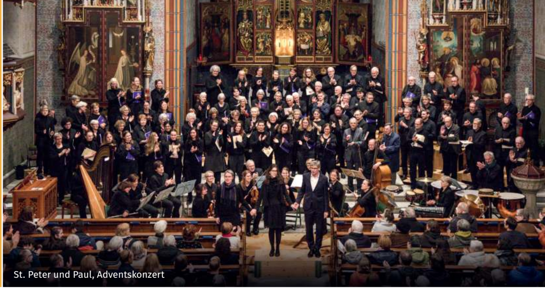
St. Peter und Paul, Adventskonzert