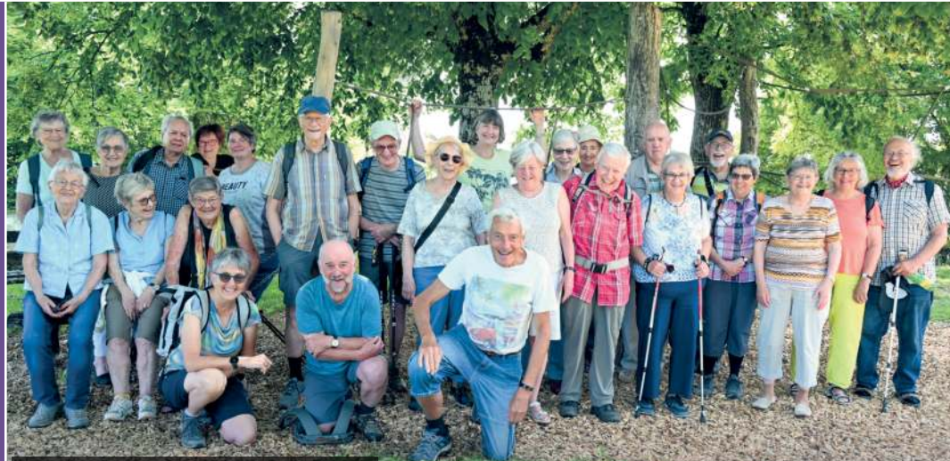
St. Ulrich / St. Peter und Paul, Seniorenferien