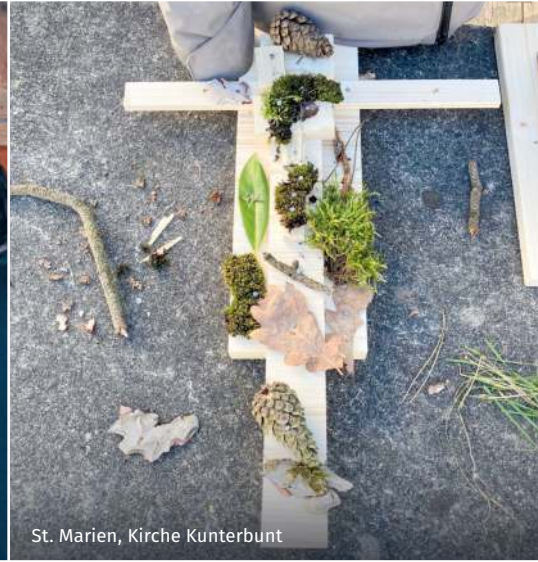
St. Marien, Kirche Kunterbunt