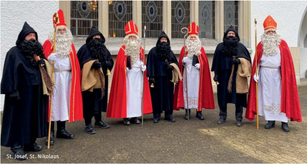
St. Josef, St. Nikolaus