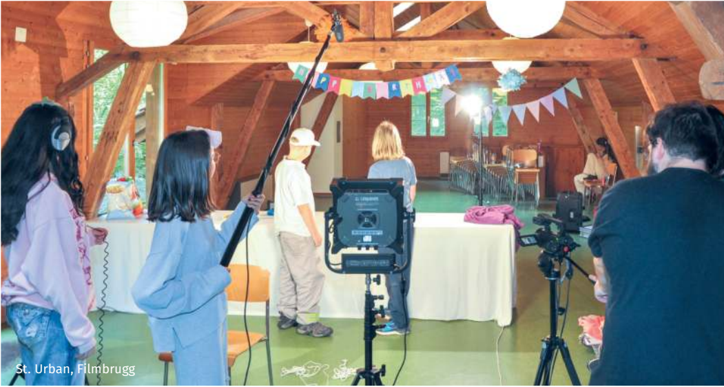
St. Urban, Filmbrugg