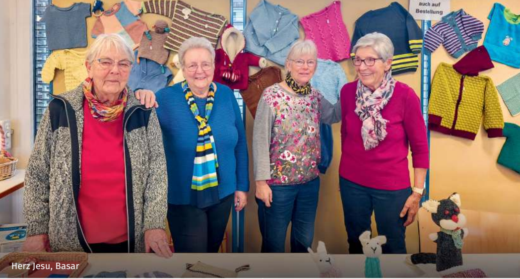
Herz Jesu, Basar