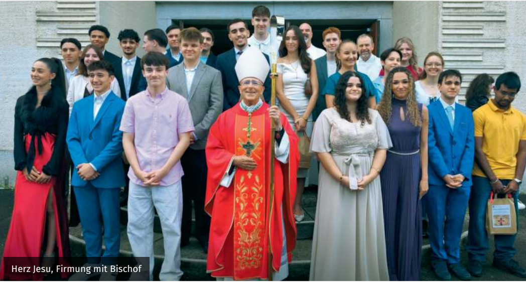
Herz Jesu, Firmung mit Bischof