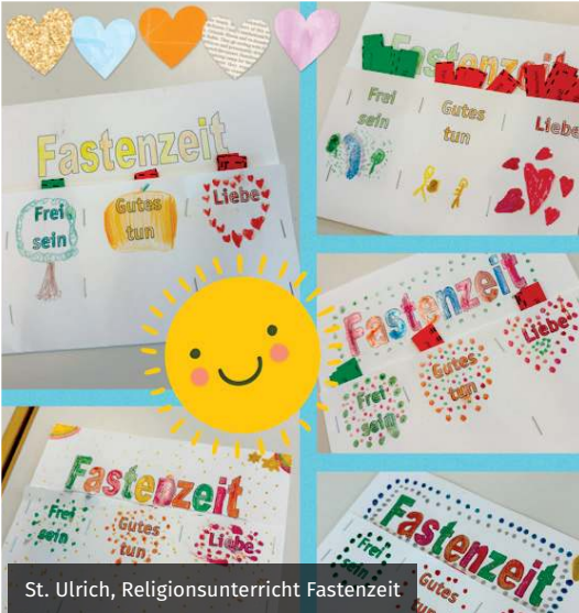
St. Ulrich, Religionsunterricht Fastenzeit