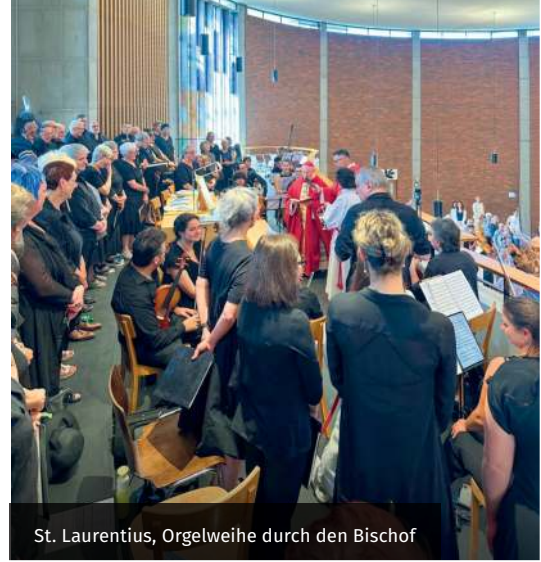
St. Laurentius, Orgelweihe durch den Bischof