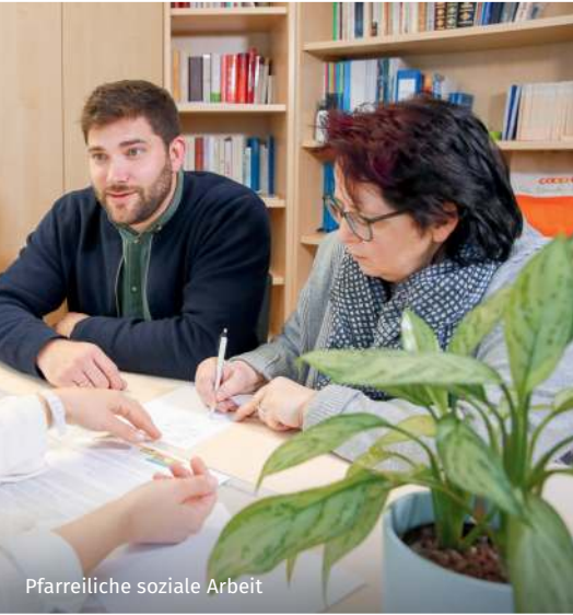
Pfarreiliche soziale Arbeit