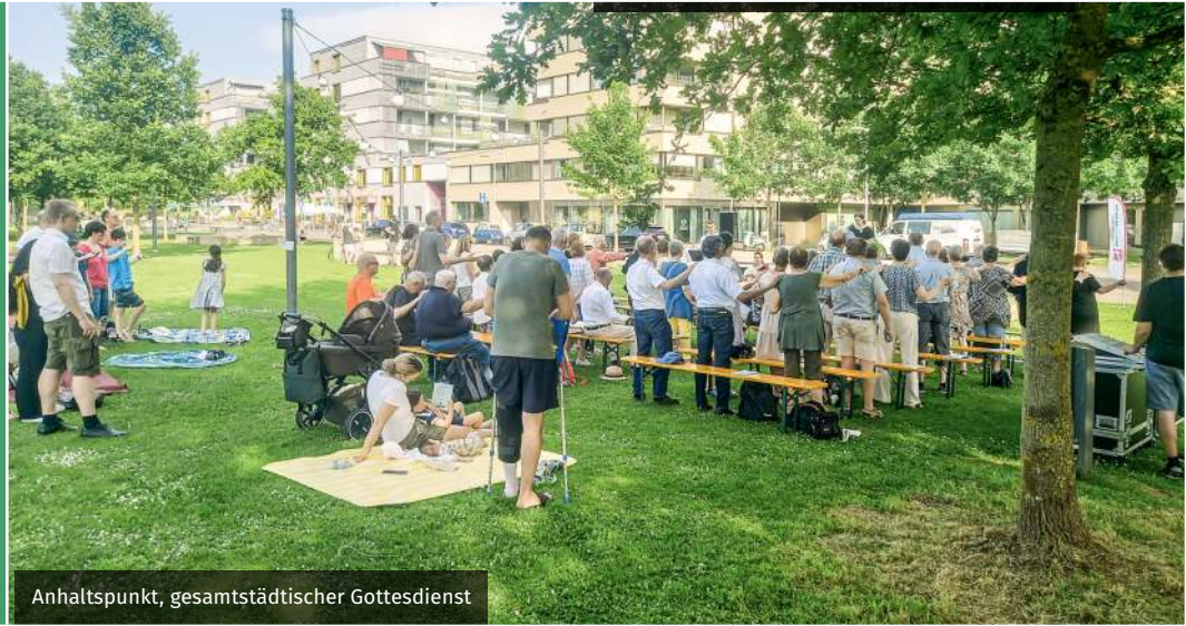
Anhaltspunkt, gesamtstädtischer Gottesdienst