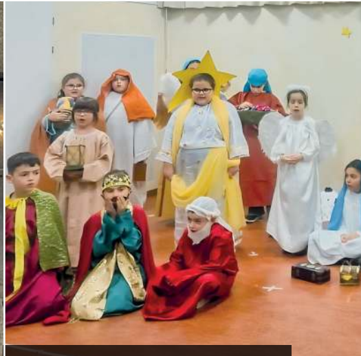
San Francisco MCLI, Weihnachtsaufführung