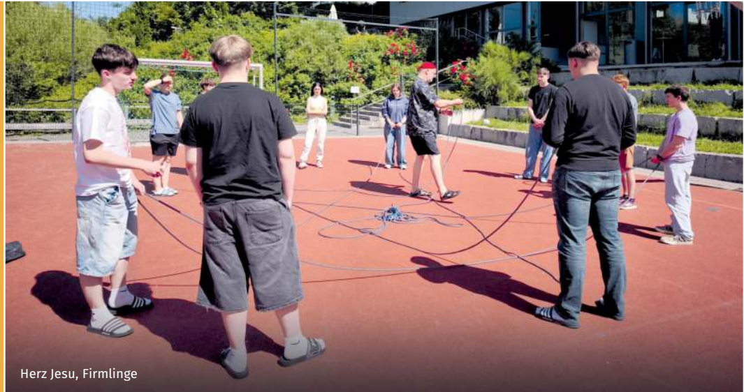
Herz Jesu, Firmlinge