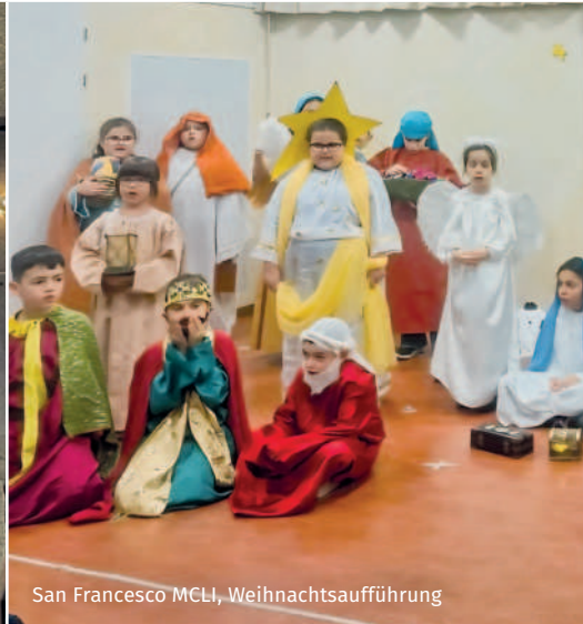
San Francesco MCLI, Weihnachtsaufführung