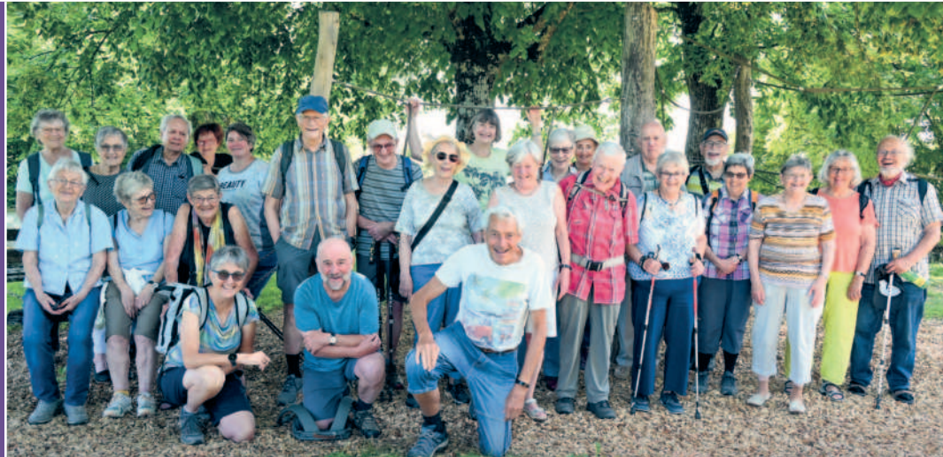
St. Ulrich / St. Peter und Paul, Seniorenferien