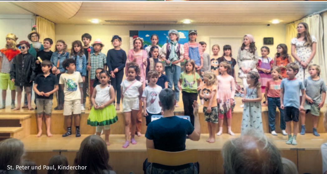
St. Peter und Paul, Kinderchor