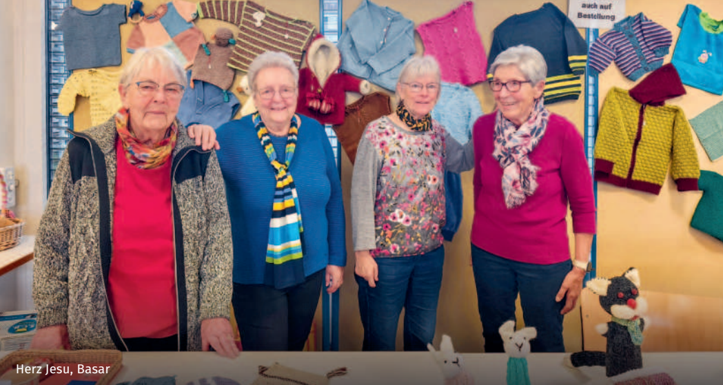
Herz Jesu, Basar