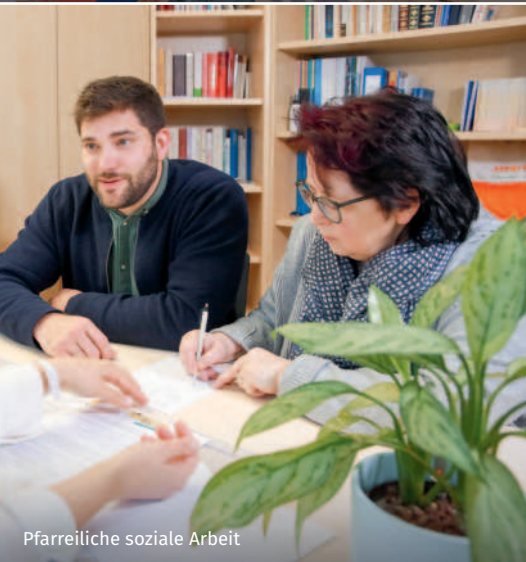
Pfarreiliche soziale Arbeit