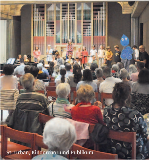
St. Urban, Kinderchor und Publikum