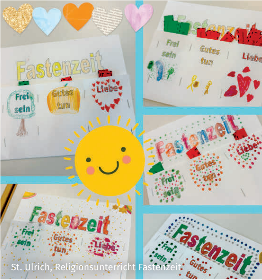
St. Ulrich, Religionsunterricht Fastenzeit