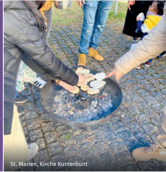
St. Marien, Kirche Kunterbunt