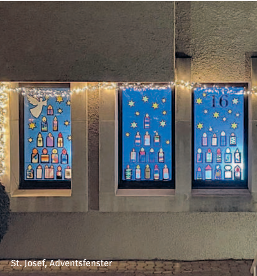
St. Josef, Adventsfenster