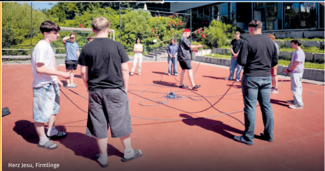
Herz Jesu, Firmlinge