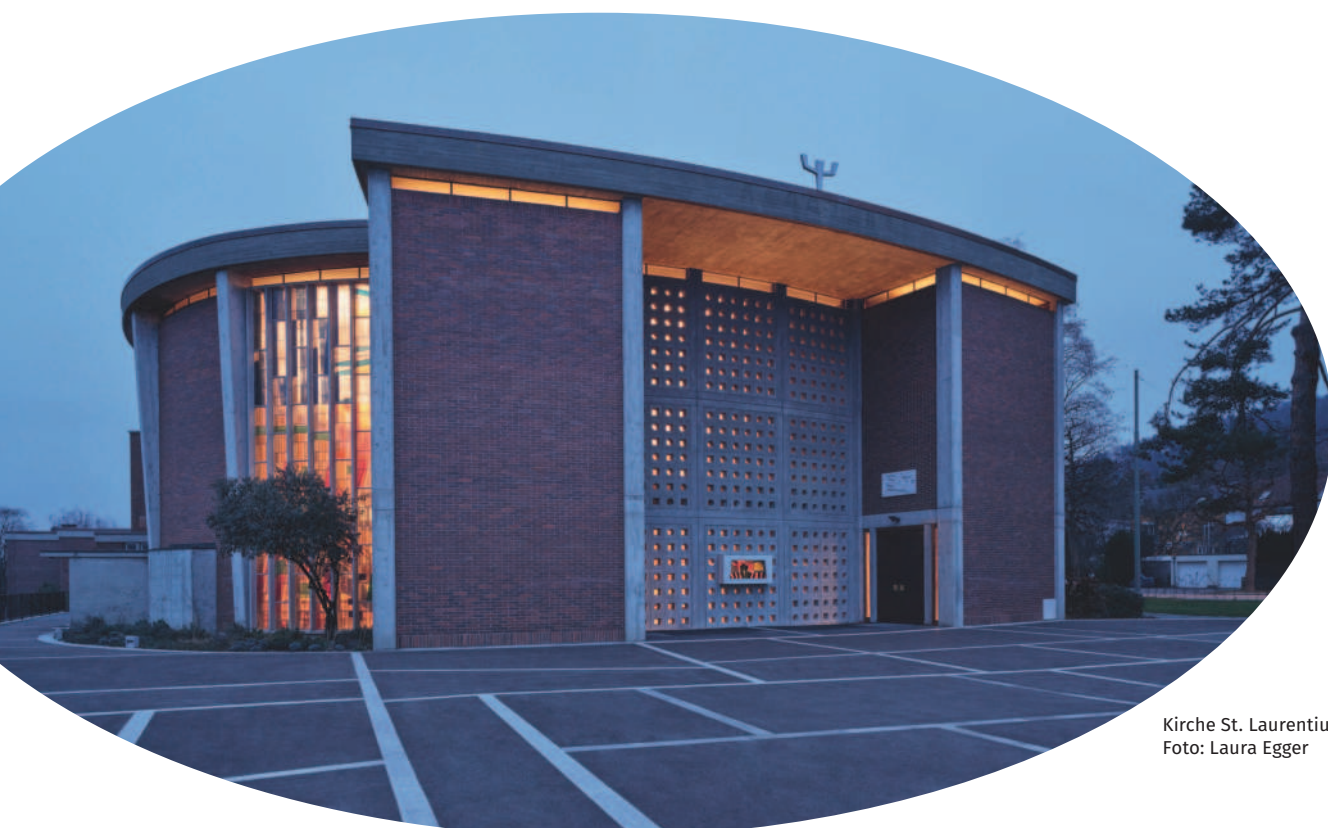
Kirche St. Laurentius, Eingangsfront

Ein weiterer Schwerpunkt unserer Arbeiten war die Renovation des ehemaligen Pfarrhauses am Oberfeldweg. Das Gebäude wurde 1924 von Architekt Kasimir Kaczorowski als Doktorhaus erstellt und im Jahr 1956 von der katholischen Kirchgemeinde übernommen. Von 1959 bis 2025 diente es als Pfarrhaus und war Teil des Ensembles St. Laurentius. Nach einer langen Zeit mit unterschiedlicher Nutzung und nur punktuellen Eingriffen wird das Gebäude sanft aufgefrischt und vor allem werden