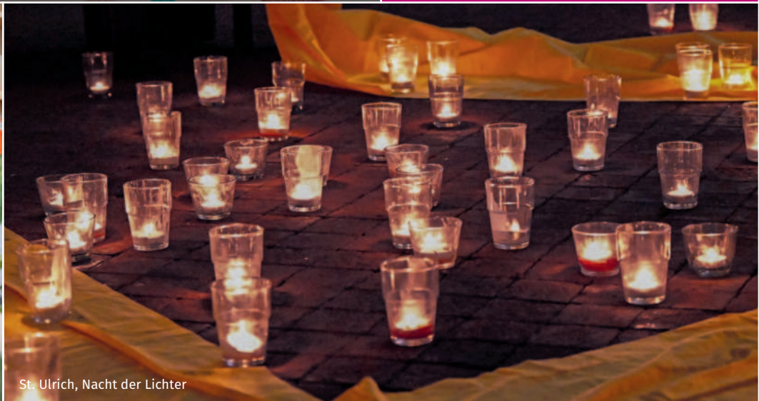
St. Ulrich, Nacht der Lichter