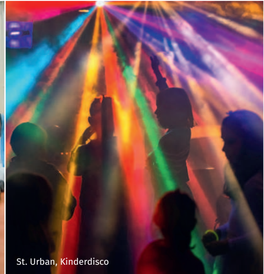
St. Urban, Kinderdisco