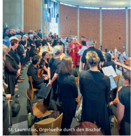
St. Laurentius, Orgelweihe durch den Bischof