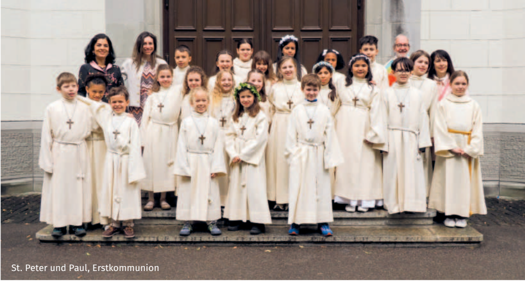
St. Peter und Paul, Erstkommunion