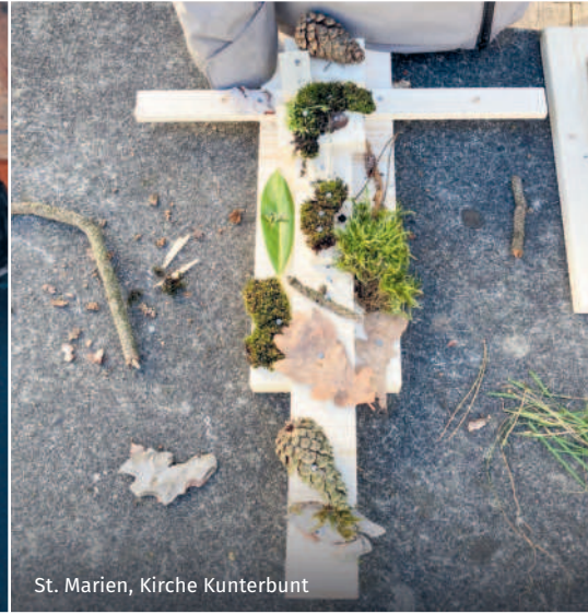
St. Marien, Kirche Kunterbunt