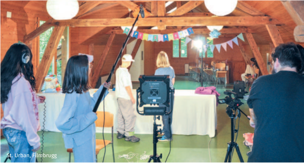
St. Urban, Filmbrugg