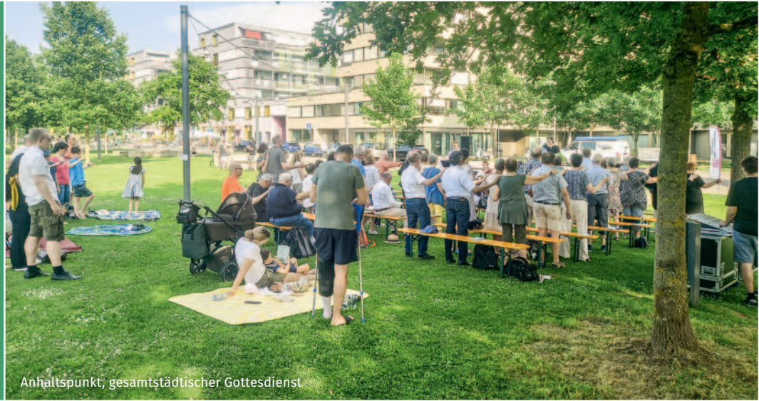
Anhaltspunkt, gesamtstädtischer Gottesdienst