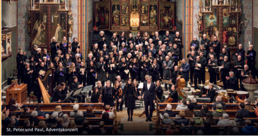
St. Peter und Paul, Adventskonzert