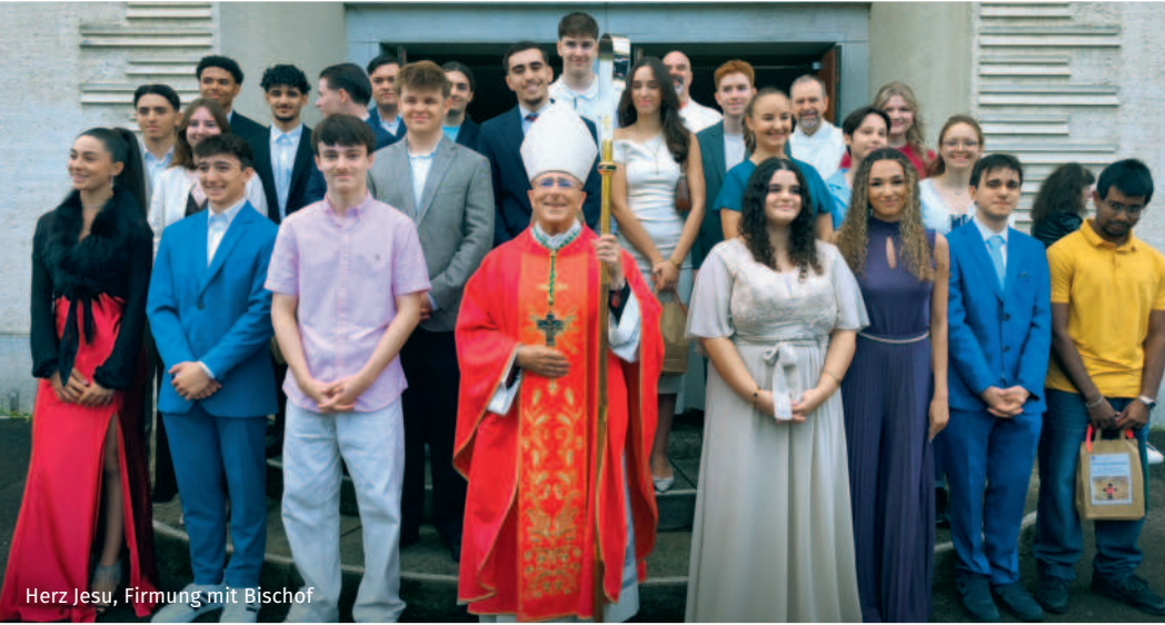
Herz Jesu, Firmung mit Bischof