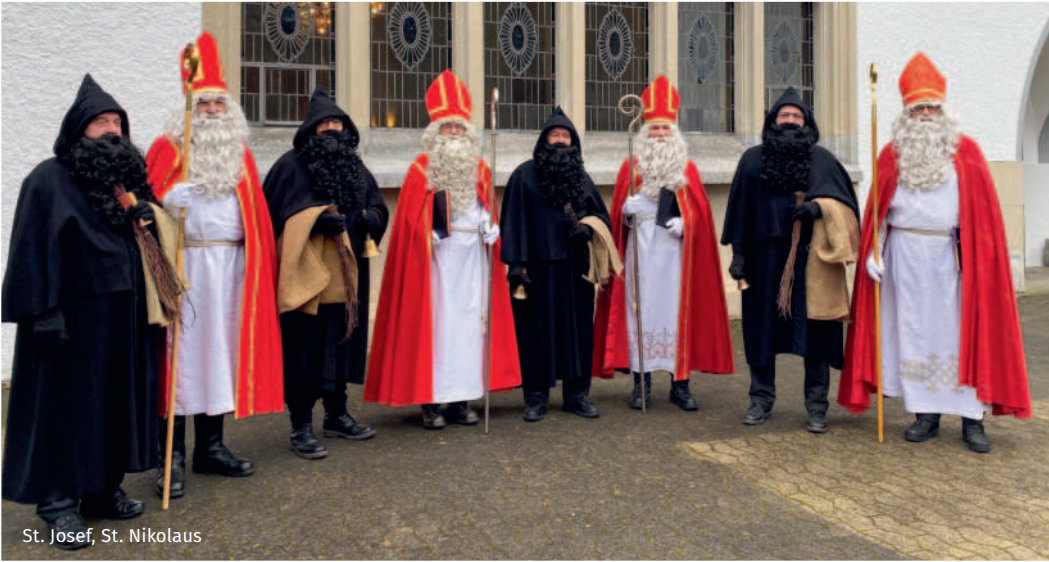
St. Josef, St. Nikolaus