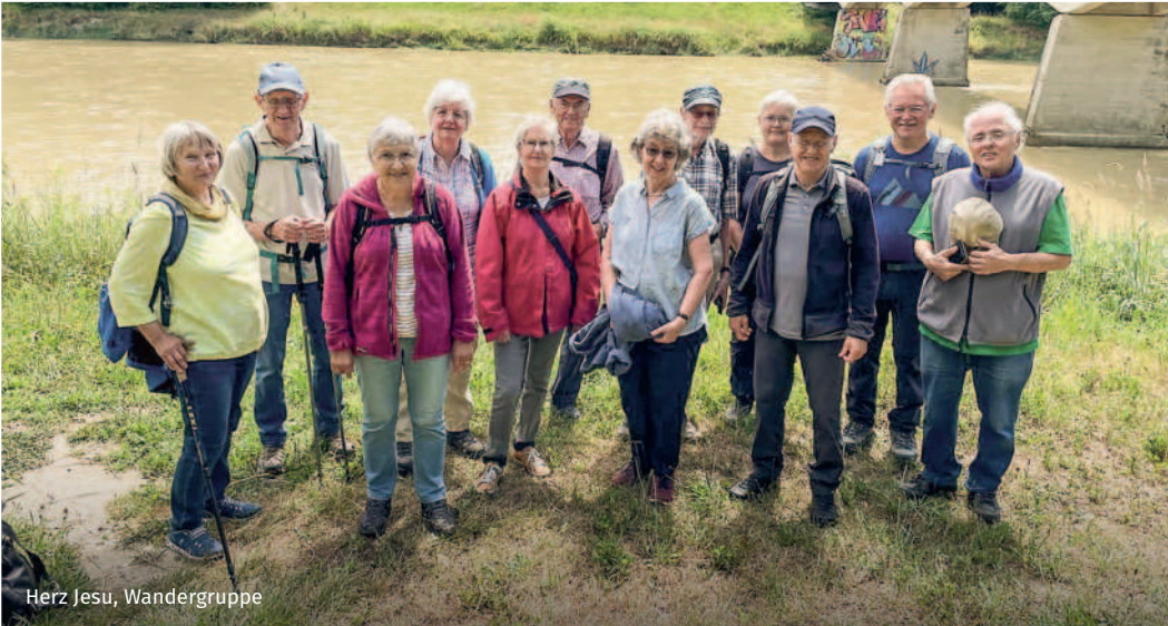
Herz Jesu, Wandergruppe