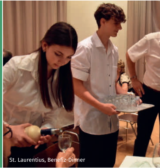
St. Laurentius, Benefiz-Dinner